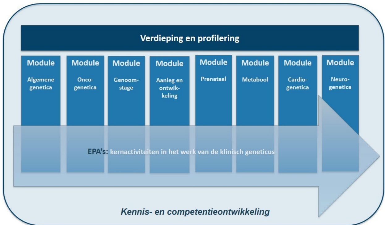
Figuur 1: verhouding bouwstenen opleiding klinische genetica

De modules betreffen medisch inhoudelijke aandachtsgebieden in de klinische genetica. De thema-overstijgende EPA's geven kernactiviteiten in het beroep van de klinisch geneticus weer. Kennis wordt zowel in modules, als bij EPA's en in het cursorisch onderwijs ontwikkeld. Binnen de opleiding is ruimte voor verdieping en profilering ten aanzien van specifieke onderwerpen.