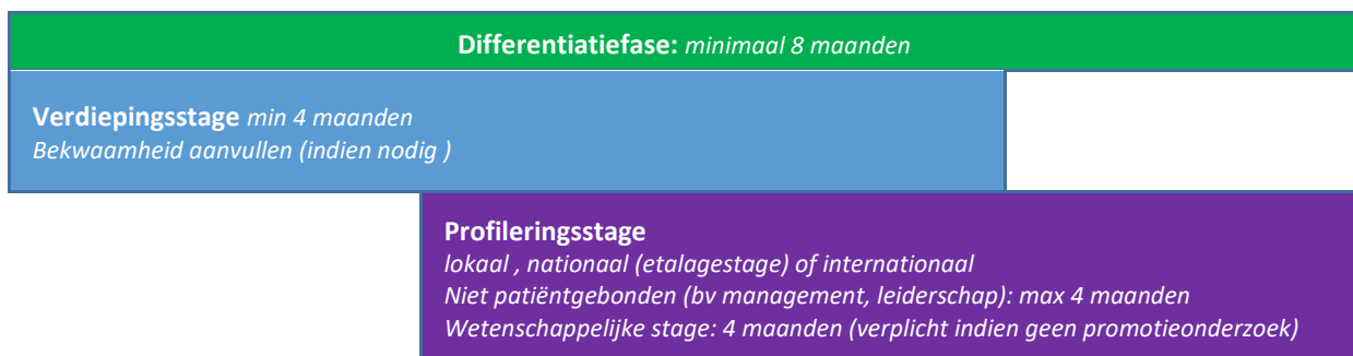
Figuur 3: Opbouw en mogelijkheden differentiatiefase

De differentiatiefase is de laatste fase van de opleiding tot klinisch geneticus. Hierin vindt een persoonlijke verdieping in een specifiek aandachtsgebied van de klinische genetica plaats (verdiepingsstage) en wordt ook de mogelijkheid geboden tot een verdere profilering (profileringstage), die ook een niet-patiëntgebonden competentie kan betreffen. De verdiepingsstage en profileringstage kunnen ook buiten de eigen opleidingsinstelling plaatsvinden. De fase zal dus voor de AIOS een verdiepende voorbereiding zijn in het gewenste aandachtsgebied (en profileringgebied) waarin zij/hij werkzaam wil zijn als klinisch geneticus. Mogelijkheden voor verdiepings- en profileringstages worden in het lokale opleidingsplan vastgelegd.